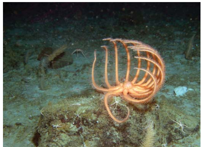
Abb. 1: Dieser vielarmige Seestern war bisher nur aus Wassertiefen unterhalb von 1000 m bekannt. Nach dem Wegbrechen des Larsen-Schelfeises an der Ostküste der Antarktischen Halbinsel wurde er dort erst kürzlich wegen ähnlicher Umweltbedingungen auch bei 150 m Wassertiefe gefunden.

Als Reaktion auf die so genannte Biodiversity Crisis gewannen in den 1980er Jahren Arbeiten zur biologischen Vielfalt erheblich an Bedeutung. Biodiversitätskrise heißt, dass eine zunehmende Zahl von Arten unwiederbringlich ausstirbt, ohne jemals von einem Wissenschaftler bearbeitet worden zu sein, während gleichzeitig durch Personalkürzungen wertvolle Erfahrungen zu den jeweiligen Tier- und Pflanzengruppen verloren gehen. Die Überzeugung zur Notwendigkeit einer globalen Bestandsaufnahme des Lebens in den Weltmeeren hat in der internationalen Gemeinschaft der Meeresbiologen dazu geführt, dass die US-amerikanische