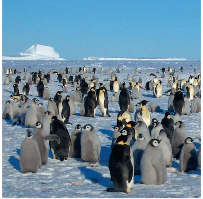
Abb. 4: Kaiserpinguine leben in der hohen Antarktis noch weitgehend in einer stabilen Umwelt – wie hier in der Atka-Bucht in der Nähe der Neumayer-Station. Sie reagieren aber empfindlich auf Veränderungen ihrer Lebensbedingungen, was sie zu einem wichtigen Forschungsobjekt in der Klimaforschung macht.

Zusammenstellung: Dr. Julian Gutt und Monika Huch