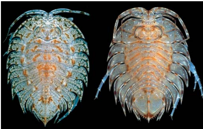
Abb. 2: Diese beiden Meeresasseln ( Ceratoserolis pasternaki und C. trilobitoides ) sind sich zum Verwechseln ähnlich. Solche „Zwillings-Arten“ haben aber unterschiedliche Umweltansprüche und können auch verschiedene Lebensräume besiedeln. Somit spielt die Kenntnis, ob die rund um den Antarktischen Kontinent vorkommenden Tieren zu derselben oder nur nahe verwandten Arten gehören, für die Abschätzung der Belastbarkeit des marinen Ökosystems eine große Rolle.

Im marinen Ökosystem des Südozeans hat sich über einen Zeitraum von Millionen Jahren eine hoch angepasste Artenvielfalt entwickelt, die besonders empfindlich auf Umweltveränderungen reagiert. Der Census of Antarctic Marine Life unterstützt vielfältige nationale und internationale Projekte und Institutionen mit Biodiversitätsschwerpunkt, die gerade auch in Deutschland in jüngster Zeit einen Aufschwung erfahren haben. Rückenwind hat diese Entwicklung durch die nahezu explosionsartige Entwicklung von molekularbiologischen Untersuchungsmethoden zur Entschlüsselung des Erbguts erfahren. Durch deren Anwendung weiß man erst seit kurzem, dass z.B. einige Meeresasseln keine zirkumantarktische Verbreitung haben, sondern dass sie sich in viele, regional begrenzte Arten gliedern (Abb. 2). Daraus resultieren entscheidende Konsequenzen für die Beurteilung der Empfindlichkeit solcher Ökosysteme. Arten mit großem Ausbreitungsgebiet sind im Falle regional begrenzter Umweltveränderungen, wie wir sie tatsächlich im Bereich der Antarktischen Halbinsel beobachten, viel weniger gefährdet als Arten, die ausschließlich in dem von den Veränderungen betroffenen Gebiet leben.