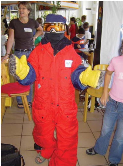
Abb. 3: Ein Kind im echten Polaranzug