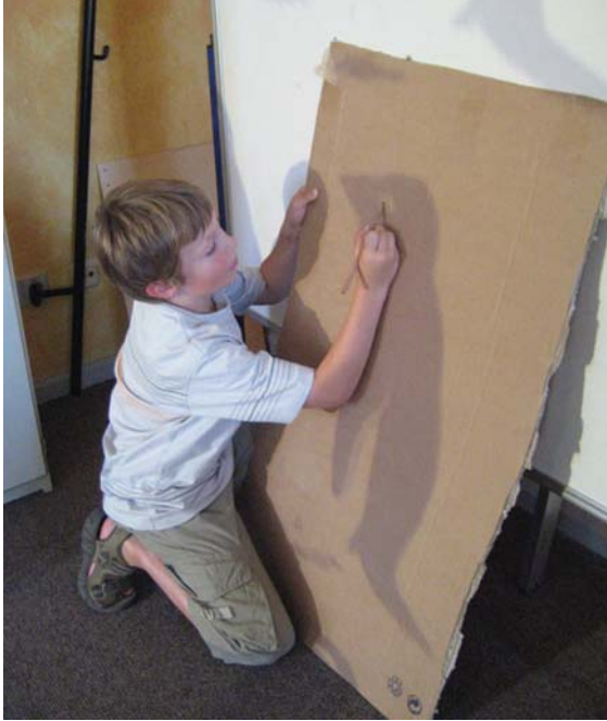
Abb. 2: Ausmalen eines Pinguin-Modells.