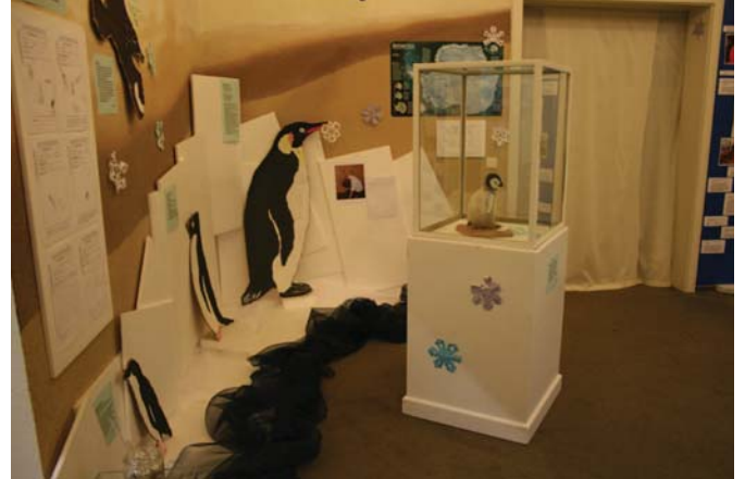
Abb. 4: Warum Pinguine und Eisbären sich nicht treffen: a) Pinguine in der Antarktis, b) Eisbären in der Arktis