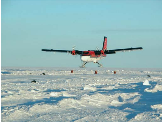
Abb. 3: Zweimotorige Twin-Otter-Maschine mit Skifahrwerk im Anflug zu einer Außenlandung auf dem Eis.

Der bei der russischen Station Progress an der Küste gelagerte Treibstoff soll entweder im Zuge dieser Landtraverse oder auf dem Luftweg mit Hilfe von australischen CASA-Flugzeugen nach AGAP-N gebracht werden. Das Lager selbst soll ebenfalls mit australischer Unterstützung eingerichtet werden. Die von hier ausgehenden Messflüge werden den nördlichsten Teil des Hauptmessgebietes sowie das Gebiet Richtung Lambert-Gletscher abdecken. Am Ende der Saison werden beide Flugzeuge von AGAP-S aus operieren. Die letzten Messflüge müssen Mitte Januar 2009 abgeschlossen werden, da Beobachtungen vergangener Jahre ergeben haben, dass zu dieser Zeit die Temperatur unter eine für den Flugbetrieb kritische Grenze von -50\text{ }^{\circ}\text{F} ( = -45\text{ }^{\circ}\text{C} ) fallen wird.