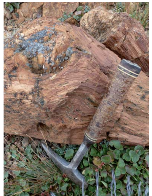
1 - Stamm mit Astansatz aus dem Paläogen (zwischen ca. 65 und 25 Millionen Jahre alt)