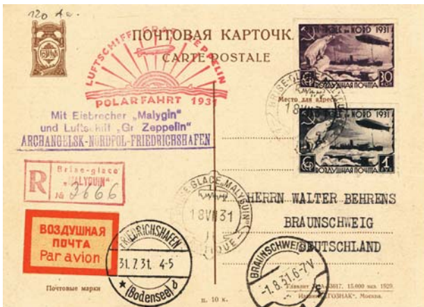
Abb. 2: Postkarte mit Nebenstempeln und russischer Frankatur, auf welcher – vorausgehend – das Treffen von LZ-127 und „Malygin“ dargestellt ist. Der Laufweg von Archangelsk per LZ-127 „Graf Zeppelin“ zur „Malygin“ über Friedrichshafen am Bodensee nach Braunschweig ist durch Nebenstempel und Poststempel dokumentiert.

Aufschlussreich ist der Vergleich der technischen Daten des LZ-127 mit dem „Zeppelin-NT“, dem größten zurzeit verfügbaren Luftschiff (Tab. 1).