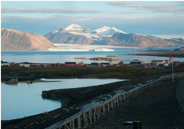
Abb. 3: Die Wissenschaftssiedlung Ny Ålesund (im Mittelgrund) am Kongsfjord auf Spitzbergen