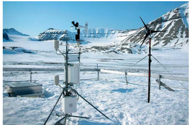
Abb. 5: Das Messfeld für Umweltdaten für die Permafrostuntersuchungen am Kongsfjord (Foto: C. Kopsch).

Auch heute begleitete uns herrlicher Sonnenschein bei unserem Marsch zu den Messfeldern außerhalb von Ny Ålesund. Gleich nach dem Mittagessen zogen wir gut ausgerüstet los. Etwa eine Stunde brauchten wir bis zu den Messfeldern des Permafrostbodens. Irgendwie war ich schon enttäuscht, da ich außer Geräten, vielen Drähten und einigen Steinhäufen nichts entdecken konnte, was mit Permafrost zu tun hat. Der Schnee hatte die Strukturen des Permafrostbodens völlig bedeckt. Dennoch ist es für die Wissenschaftler sehr interessant zu erforschen, was mit dem Permafrostboden in der Zukunft geschieht. An dem Messfeld wo wir waren, werden seit 1998 regelmäßige Messungen vorgenommen (Abb. 5).