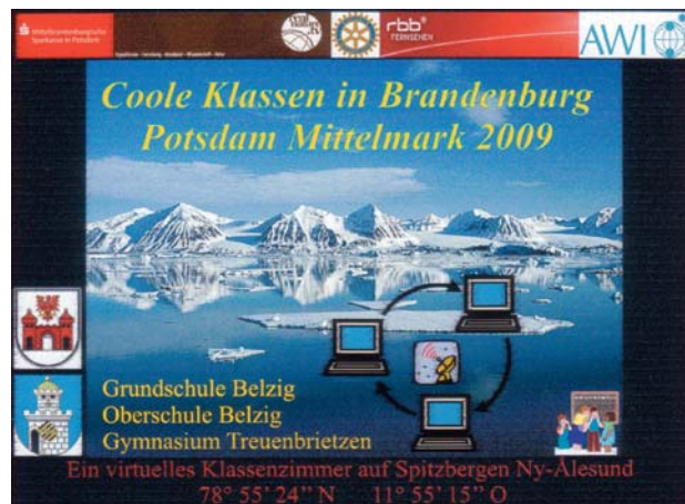
Abb. 1: Ankündigung des Projekts und Aufkleber für die Schüler.