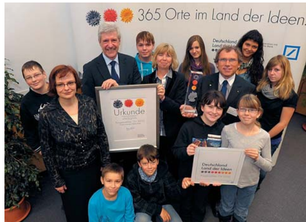
Abb. 7: Der Brandenburger Minister für Bildung, Jugend und Sport freut sich gemeinsam mit den Preisträgern über die Auszeichnungen durch die Initiative „Deutschland – Land der Ideen“.

Wir sind gespannt und freuen uns darauf dass es weiter geht!