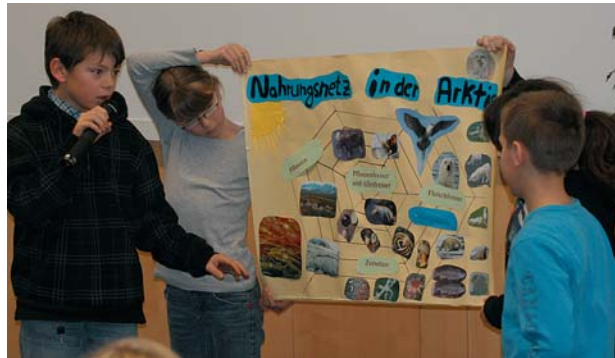
Abb. 6: Bei der Auszeichnung der AWI-Forschungsstelle Potsdam als „Ausgewählter Ort“ im Innovationswettbewerb „365 Orte im Land der Ideen“ zeigen Schüler und Schülerinnen der Geschwister-Scholl-Grundschule Belzig, was sie im Projekt „Coole Klassen Potsdam“ zum Thema „Nahrungskette der Arktis“ gelernt haben.